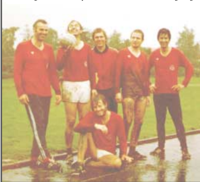
Pokalsieger SV Großenasper bei der Schlammschlacht in Segeberg