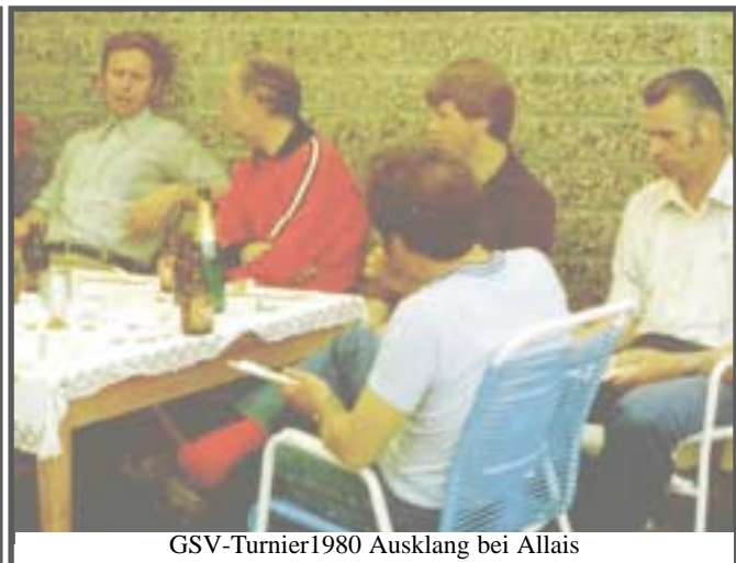
GSV-Turnier 1980 Ausklang bei Allais

Zwischenrunde noch recht gekämpft werden. Zum Schluß traten folgende Mannschaften als Sieger hervor: