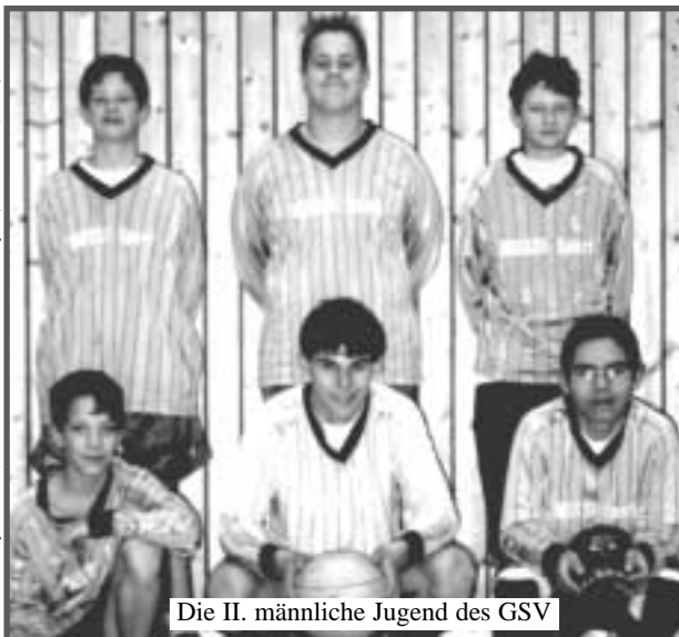
Die II. männliche Jugend des GSV

Niveau größtenteils recht hoch, so daß die Mannschaft des GSV noch oftmals überfordert wirkte. Ein Platz im Mittelfeld stellte die Erwartungen der Spartenführung aber zufrieden. Die Aussichten für die Zukunft dieser Mannschaft sind ebenfalls nicht schlecht, da die meisten der Mädchen vor 2 Jahren noch gar nicht wußten, was Faustball ist.