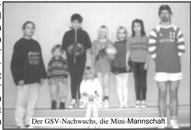
Der GSV-Nachwuchs, die Mini-Mannschaft

In der Hallenserie wollte man in der Spitzengruppe mitmischen, was vom spielerischen Potential und den Erfahrungen aus dem Vorjahr sicherlich auch möglich war. Aber irgendwie lief es von Anfang an nicht so rund und bereits zu Beginn der Saison verlor man einige unnötige Punkte. Die gesamte Mannschaft wirkte nicht nur im Training etwas unmotiviert und wurde zudem im Laufe der Saison nicht von Verletzungen und Wehwechen verschont. So konnte man im Laufe der Saison fast alle Spieltage lediglich mit 2 : 2 Punkten abschließen, was nicht für einen Spitzenplatz