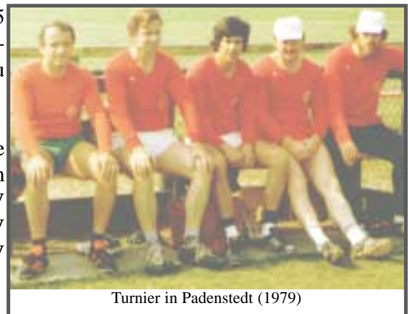
Turnier in Padenstedt (1979)