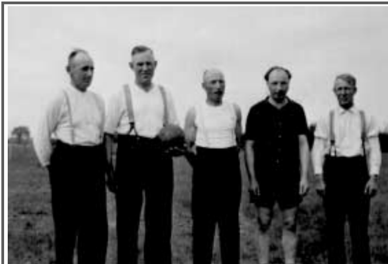
Aus Anlaß des 10-jährigen Bestehens (1956) des GSV, zeigten sowohl die ehemaligen "Freizeit"-Faustballer, als auch die derzeitige Turnriege das Können des Faustballspielens.

Nach dem Bau der Turnhalle in Großenaspe (1963) fand ein regelmäßiges Training statt. Dieses war jeweils „donnerstags“ und hat sich bis zum heutigen Tag erhalten. In dem selben Jahr kam es zur Geburtsstunde der